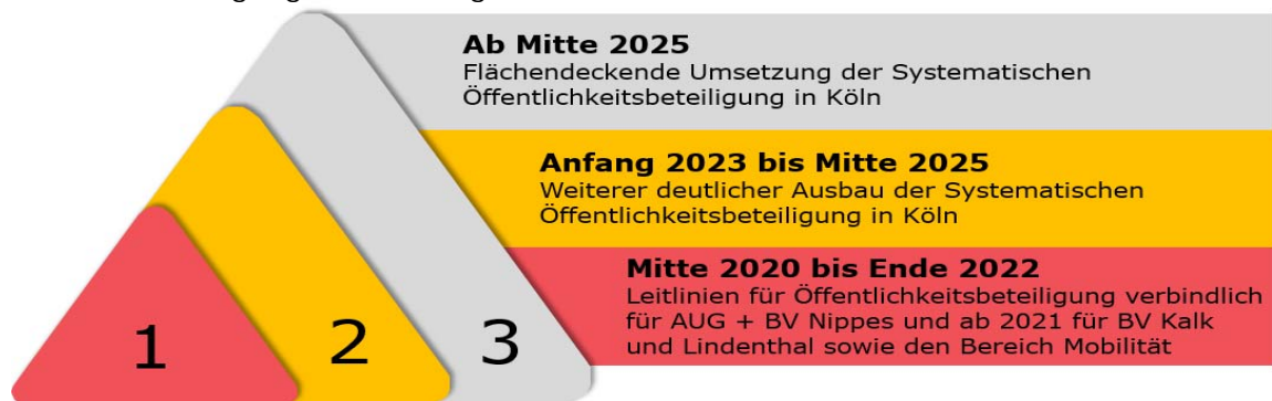
Grafik: Ausbau der Systematischen Öffentlichkeitsbeteiligung in Köln

Aus heutiger Sicht ist ein weiterer Schritt Anfang 2023 bis Mitte 2025 mit einem weiteren deutlichen Ausbau erforderlich, bevor dann die flächendeckende Umsetzung Systematischer Öffentlichkeitsbeteiligung in Köln hergestellt werden kann: