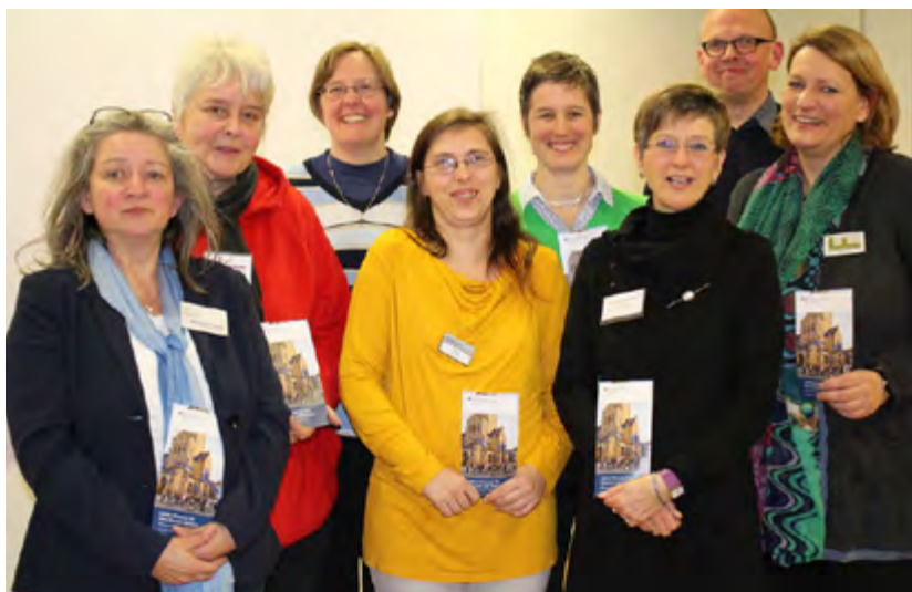
Die Netzwerkpartnerinnen und -partner auf dem Kino- und Infoabend.

DUO entlastet Familien mit Demenzerkrankten durch Freiwillige